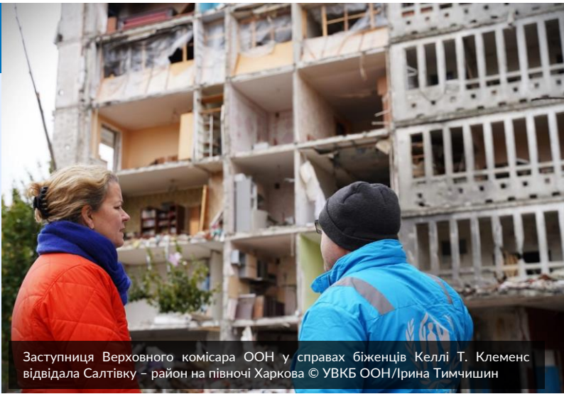
Заступниця Верховного комісара ООН у справах біженців Келлі Т. Клеменс відвідала Салтівку – район на півночі Харкова

12 листопада на брифінгу у Женеві Келлі Т. Клеменс звернула увагу на стійкість людей, з якими вона зустрічалася в Україні, і закликала до більшої підтримки, щоб допомогти цивільному населенню пережити осінньо-зимовий період, оскільки російські обстріли і далі руйнують енергетичні та інші об'єкти цивільної інфраструктури. Читайте більше ТУТ .