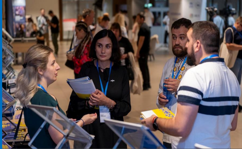
27 та 28 серпня 2024 року в Києві відбувся Всеукраїнський форум Рад ВПО. Це вже другий Національний форум, проведений у партнерстві з БФ «Стабілізаційний Суппорт Сервісез», УВКБ ООН та IREX під егідою Міністерства з питань реінтеграції тимчасово окупованих територій України. © Євген Воронцов, серпень 2024 р.