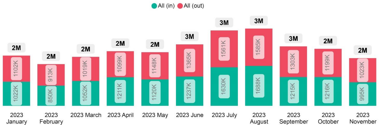
Мал 1. Примітка: графік базується на даних, доступних публічно на ресурсах ДПСУ та стосується перетинів кордону з Україною з чотирма країнами: Польща, Словаччина, Угорщина та Румунія, і не включає дані щодо Молдови.