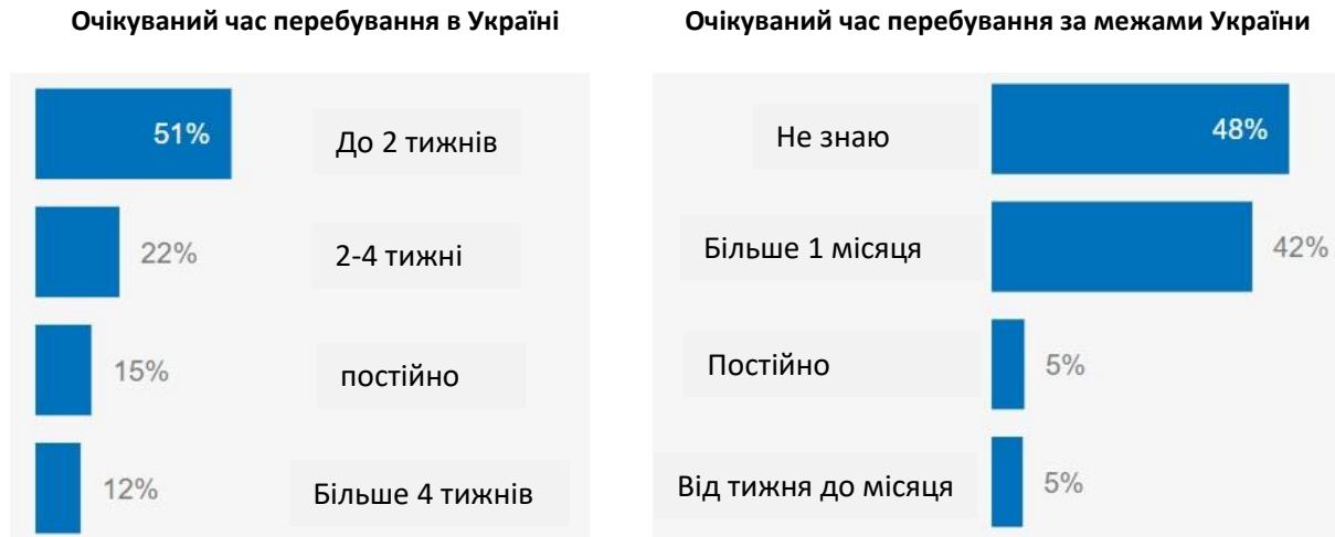
Таб 1. Інформація стосується виключно вибірки людей, які повідомляли, що полишають Україну в пошуку безпеки

Протягом звітнього періоду 48% респондентів серед тих, хто виїжджає в пошуку безпеки, не були впевнені щодо тривалості свого перебування за кордоном, а 42% підкреслювали, що залишатимуться там довше, ніж один місяць. Серед біженців, які повертаються, 51% опитаних повідомили, що планують повернутися в приймаючу країну після перебування в Україні до двох тижнів, а 15% опитаних повідомили, що повертаються остаточно.