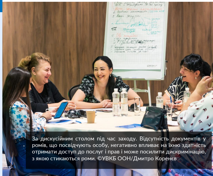
За дискусійним столом під час заходу. Відсутність документів у ромів, що посвідчують особу, негативно впливає на їхню здатність отримати доступ до послуг і прав і може посилити дискримінацію, з якою стикаються роми.

Докладніше про подію та про те, як УВКБ ООН працює з ромською громадою, читайте ТУТ .