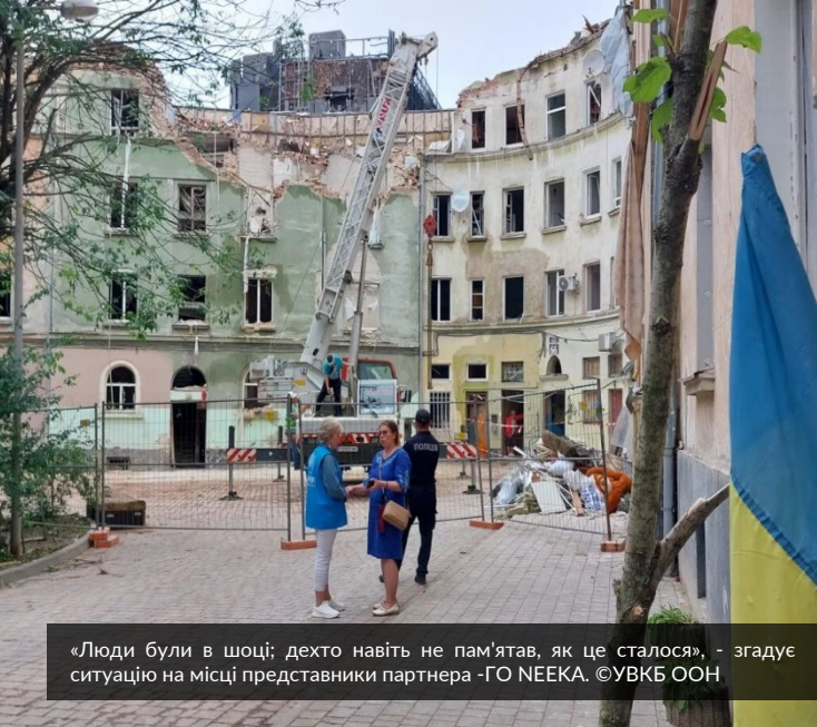
«Люди були в шоці; дехто навіть не пам'ятав, як це сталося», - згадує ситуацію на місці представники партнера -ГО НEEКА.

У координації з місцевою та регіональною владою УВКБ ООН та його партнери допомагають розмістити людей, які втратили своє житло, у місцях компактного проживання по всьому регіону та забезпечують сім'ї матеріалами для ремонту своїх пошкоджених будинків. Детальніше читайте ТУТ .