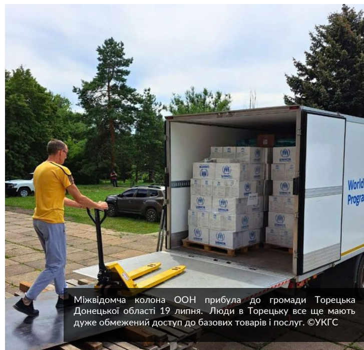
Міжвідомча колона ООН прибула до громади Торецька Донецької області 19 липня. Люди в Торецьку все ще мають дуже обмежений доступ до базових товарів і послуг.