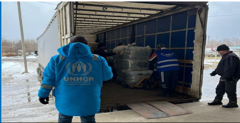
Розвантаження таких речей від УВКБ ООН, як термоковдри, спальні мішки, сонячні лампи, каністри та обігрівачі на твердому паливі для підтримки людей у Боровій, Харківська область, 21 лютого.

Дивіться відео конвою, який 16 лютого доставив допомогу у прифронтове місто Курахове на Донеччині тут .