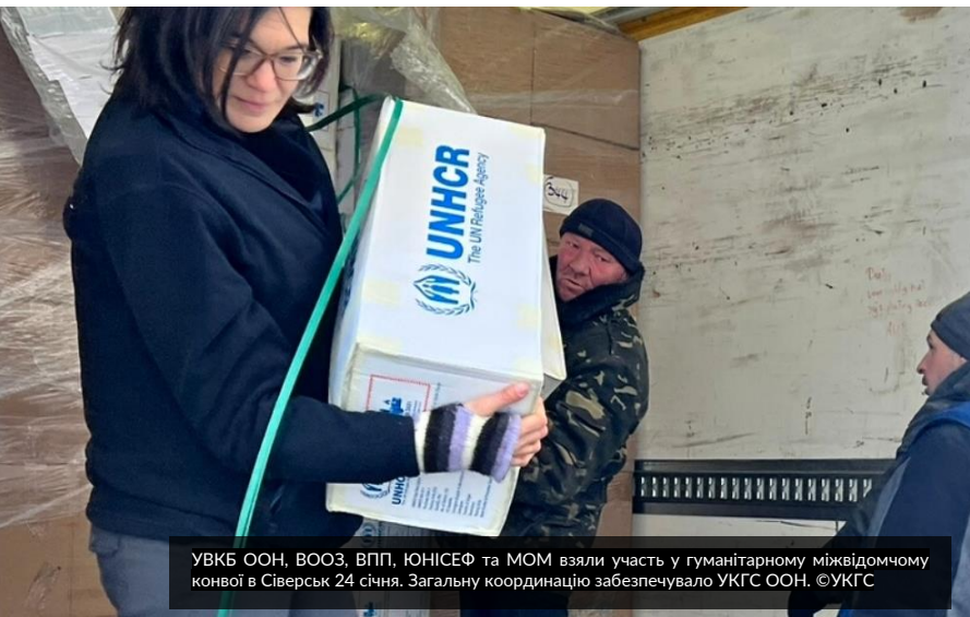
УВКБ ООН, ВООЗ, ВПП, ЮНІСЕФ та МОМ взяли участь у гуманітарному міжвідомчому конвої в Сіверськ 24 січня. Загальну координацію забезпечувало УКГС ООН.

УВКБ ООН і надалі надаватиме пріоритет участі в міжвідомчих гуманітарних конвоях для надання допомоги людям, які мешкають у місцях, де точаться активні бойові дії.