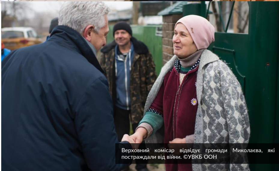
Верховний комісар відвідує громади Миколаєва, які постраждали від війни.