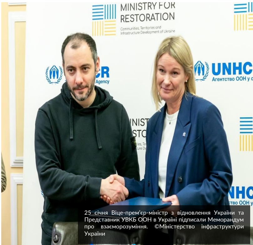
25 січня Віце-прем'єр-міністр з відновлення України та Представник УВКБ ООН в Україні підписали Меморандум про взаєморозуміння.