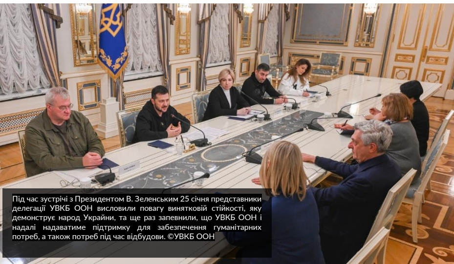
Під час зустрічі з Президентом В. Зеленським 25 січня представники делегації УВКБ ООН висловили повагу винятковій стійкості, яку демонструє народ України, та ще раз запевнили, що УВКБ ООН і надалі надаватиме підтримку для забезпечення гуманітарних потреб, а також потреб під час відбудови.