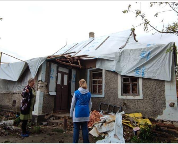
Набори для екстреного ремонту доставлені для забезпечення постраждалих домівок в селищах Херсонської області, до яких відновлено доступ. Жителі також отримали матраци та спальні мішки. Вересень 2022.