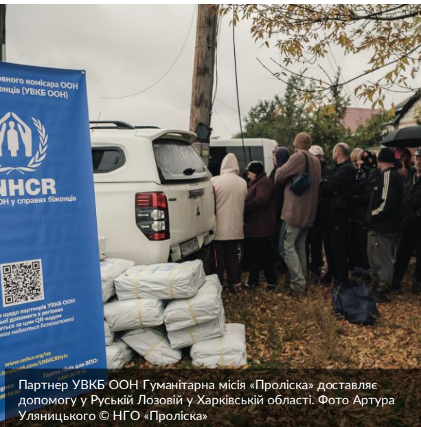
Партнер УВКБ ООН Гуманітарна місія «Проліска» доставляє допомогу у Руській Лозовій у Харківській області.