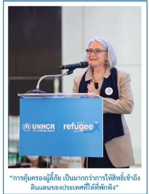
“การคุ้มครองผู้ลี้ภัย เป็นมากกว่าการให้สิทธิ์เข้าถึงดินแดนของประเทศที่ให้ที่พักพิง”

ล่าสุดเมื่อเข้าประจำการประเทศไทย คุณแทมมีเข้าปฏิบัติงานในพื้นที่ค่ายพักพิงชั่วคราวบ้านถ้ำหิน จังหวัดราชบุรีโดยทันที