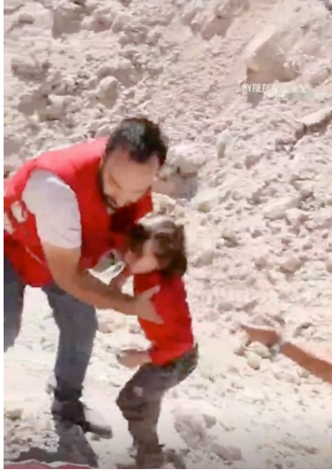
فرق الهلال الأحمر العربي السورية تساعد السوريين واللبنانيين على عبور موقع الضربة الجوية قرب معبر المصنع/جديدة يابوس الحدودي مع سورية. يقوم الهلال الأحمر بتمويل من المفوضية الآن بتقديم خدمات الحافلات لنقل الأشخاص الضعفاء إلى مكتب الهجرة السوري (حوالي 4 كم).