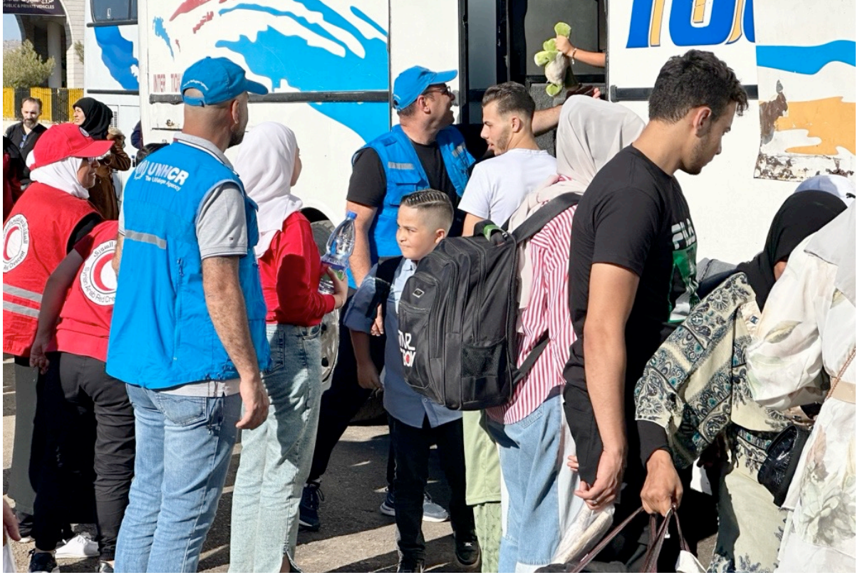
المفوضية والهلال الأحمر العربي السوري تقدمان المساعدة في النقل للوافدين

فترة التقرير 24 أيلول/ سبتمبر - 5 تشرين الأول/ أكتوبر 2024