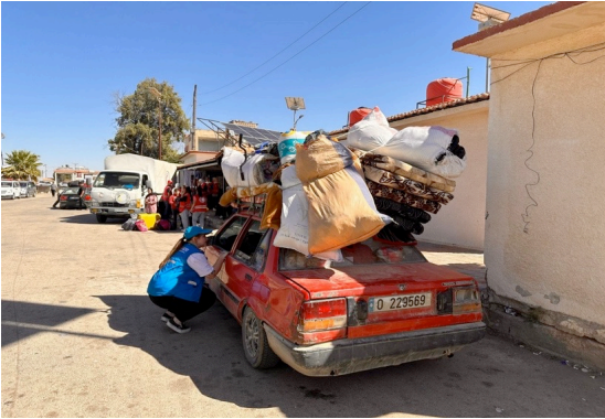
تدعم المفوضية للعائلات الوافدة في المعابر الحدودية.