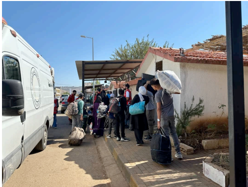
الوافدون إلى معبر جسر قمار الحدودي (حمص).