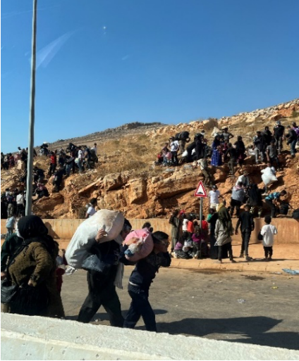
أفراد يصلون إلى نقطة جديدة يابوس الحدودية على الأقدام.