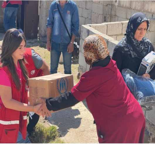
توزيع مواد الإغاثة الأساسية على العائلات اللبنانية التي وصلت مؤخراً إلى حمص.

○ في حمص، قامت السلطات بافتتاح مركزي إيواء يستضيفان 30 عائلة لبنانية (150 فرد). وقد قدمت المفوضية حزم المواد غير الغذائية، التي تضم البطانيات والفرشات وأدوات المطبخ والشوادر البلاستيكية، وحصائر النوم، والمصابيح الشمسية، وجالونات المياه، والملابس الشتوية. كما تقوم المفوضية بتوزيع حزم المواد غير الغذائية لصالح 480 عائلة (من اللبنانيين والسوريين) الذين تستضيفهم المجتمعات المحلية.