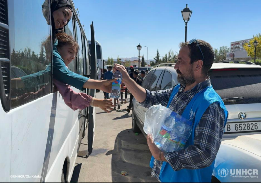
توزيع المفوضية عبوات المياه على الوافدين في معبر جديدة يابوس.

○ يدعم كل من قطاع الصحة/ منظمة الصحة العالمية ووزارة الصحة، كي ترسل الفرق الطبية إلى كل من النقاط الحدودية، عبر تقديم المستلزمات الصحية لمتابعة الخدمات الأساسية، وتعزيز الكشف عن الأمراض، ومنع تفشيها والتلقيح الذي يستهدف الأطفال دون سن الخامسة. ○ بالإضافة إلى تقديم المستلزمات النسائية الشخصية، يقدم صندوق الأمم المتحدة للأسرة، بالتعاون مع المنظمات المحلية غير الحكومية، الدعم للنساء الحوامل والنساء في سن الإنجاب على النقاط الحدودية.