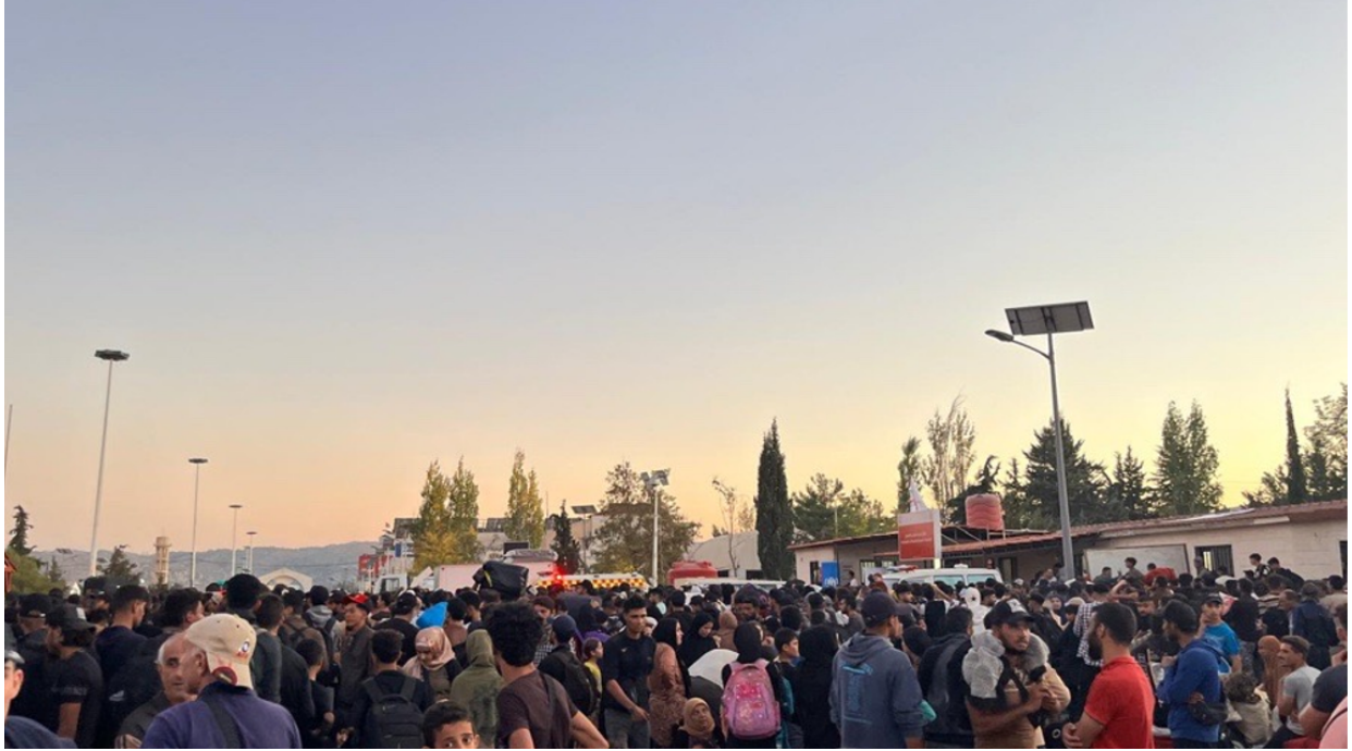
مساء 28 أيلول/سبتمبر، أعداد كبيرة من الأفراد الذين يعبرون نقطة جديدة بابوس الحدودية إلى سورية

69,000 1 فرد (من اللبنانيين والسوريين) يقدّر أنهم عبروا من لبنان إلى سورية منذ تصعيد الأعمال العنيفة في لبنان. في 28 أيلول/ سبتمبر، شهدت المفوضية زيادة كبيرة في نسبة اللبنانيين من عدد الوافدين على المعابر الحدودية.