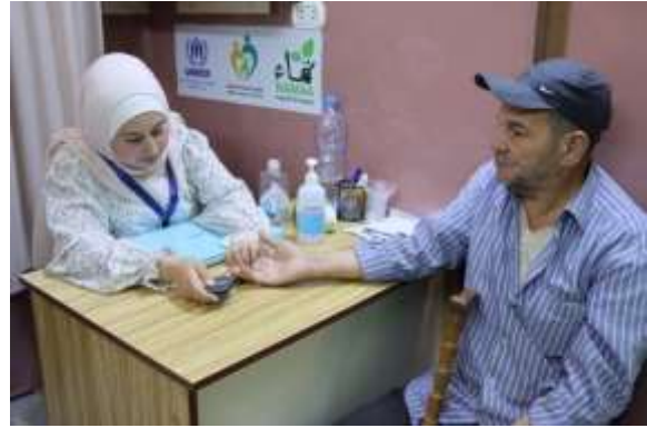
الاستشارة الصحية في نقطة السكري الصحية، بمحافظة حلب.