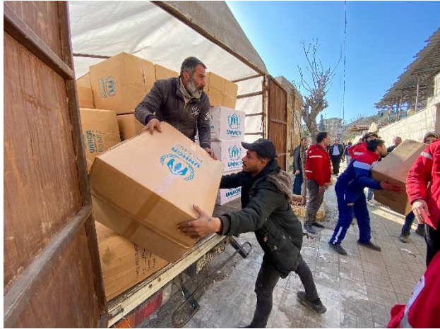
توزيع مواد الإغاثة الأساسية في شباط على الأفراد المقيمين في مسجد بحلب.

حتى نهاية شباط/فبراير ورّعت المفوضية حوالي 23,100 حزمة/مجموعة من مواد الإغاثة الأساسية لصالح 109,800 شخصاً. وسيتم إرسال المزيد من مواد الإغاثة الأساسية لتوزيعها على العائلات المتضررة في محافظات حلب واللاذقية وطرطوس وحماة وجنوب إدلب. كما أرسلت المفوضية 68,300 سترة شتوية و31,450 مجموعة ملابس شتوية من مستودعاتها في حلب وطرطوس وحمص لفائدة العائلات المتضررة. هذا بالإضافة إلى إرسال حوالي 537,900 من حفاظات الكبار، الضرورية للآلاف من كبار السن والأفراد ذوي الإعاقة، لتوزيعها.