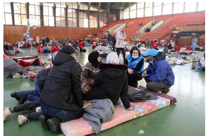
نقاش مع الأفراد المتضررين من الزلازل في مركز الإيواء بالمدينة الرياضية في اللاذقية، حيث قدّمت المفوضية مواد الإغاثة الأساسية وخدمات الحماية. © المفوضية/ع. كباس

****المصدر: المفوضية، 28 شباط/فبراير 2023