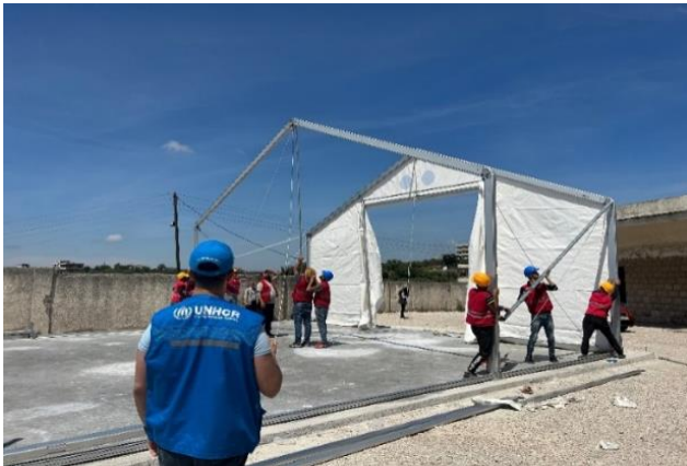
تركيب خيمة كبيرة الحجم في اللاذقية ليتم استخدامها كصف دراسي مؤقت للأطفال.

وفي محافظة اللاذقية، استكملت المفوضية تسليم خمس خيام كبيرة الحجم من أصل ثمان خيام في أربع مدارس يتم استخدامها حالياً كمراكز إيواء. حيث يتم تركيب هذه الخيام في باحات المدارس لاستخدامها كصفوف دراسية مؤقتة للأطفال فيما يتم العمل لتركيب الخيام الباقية.