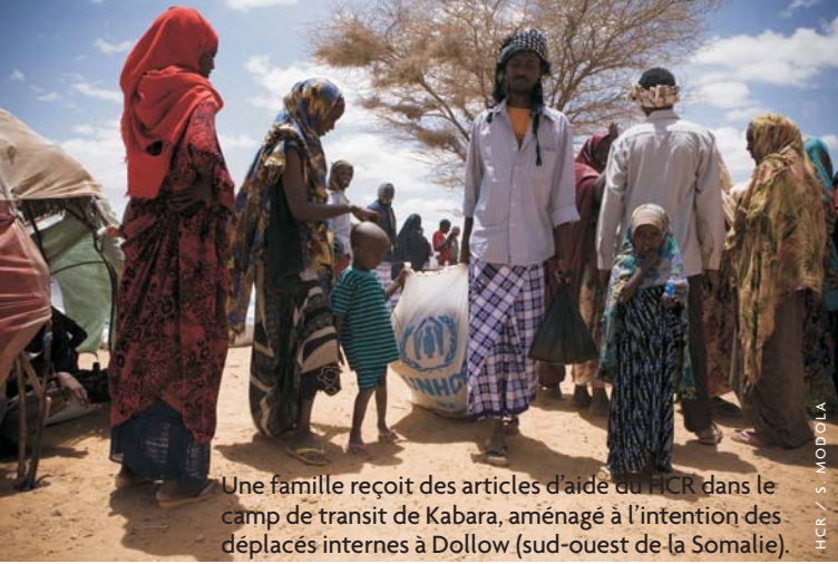
Une famille reçoit des articles d'aide du HCR dans le camp de transit de Kabara, aménagé à l'intention des déplacés internes à Dollow (sud-ouest de la Somalie).