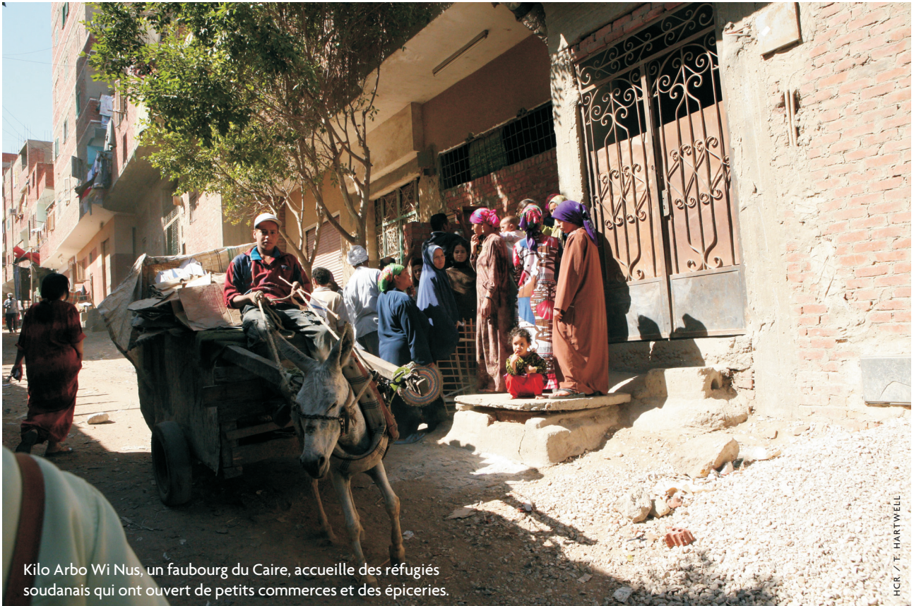
Kilo Arbo Wi Nus, un faubourg du Caire, accueille des réfugiés soudanais qui ont ouvert de petits commerces et des épicereries.