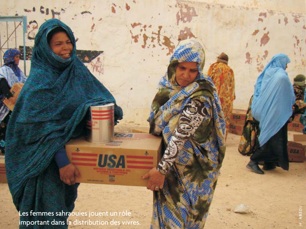
Les femmes sahraouies jouent un rôle important dans la distribution des vivres.