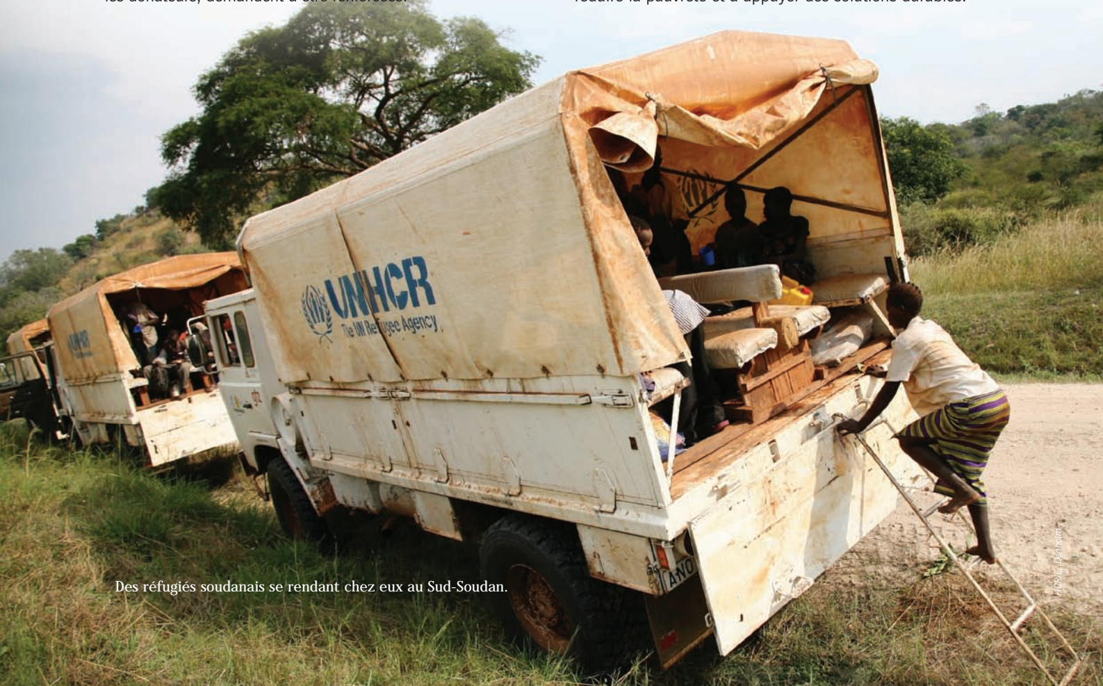
Des réfugiés soudanais se rendant chez eux au Sud-Soudan.

À Khartoum, les besoins de protection des réfugiés et des demandeurs d'asile sont principalement la conséquence de la faible capacité des structures gouvernementales, qui ne parviennent pas à appliquer une politique d'asile efficace, à réduire la pauvreté et à appuyer des solutions durables.