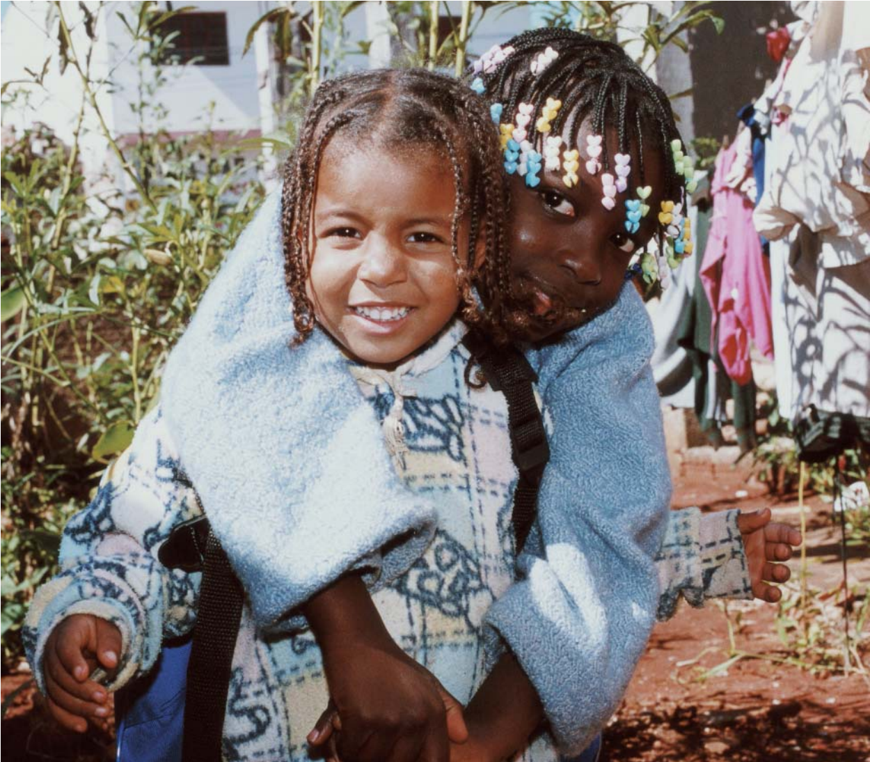
Le Brésil s'est révélé être l'un des principaux pays de réinstallation en Amérique latine.

institutionnels et sociaux de la protection de l'enfance. Les premiers résultats, obtenus grâce au détachement d'un spécialiste de la protection de l'enfance à Tapachula, se sont avérés encourageants, puisque cette question commence à susciter l'intérêt. Une initiative a été lancée en vue de créer un groupe de travail interorganisations consacré à ce sujet.