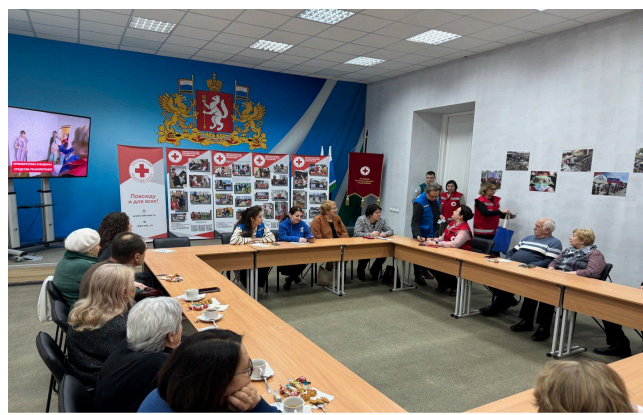
Встреча с украинскими беженцами, проживающими вне пунктов временного размещения, в региональном отделении Российского Красного Креста в Екатеринбурге