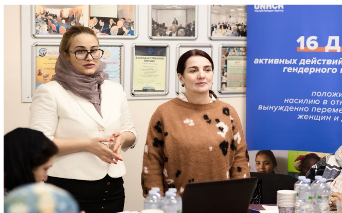
Семинар по психосоциальной поддержке в Москве, проведенный при поддержке УВКБ ООН

*финансирование за счет нецелевых взносов