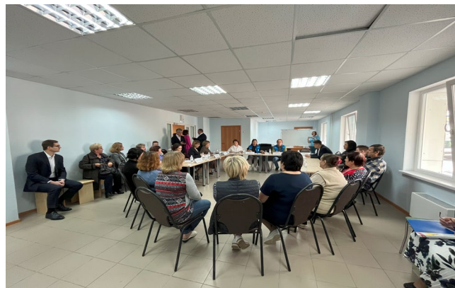
Встреча по оценке потребностей с украинскими беженцами в Сургуте (Ханты-Мансийский Автономный Округ)