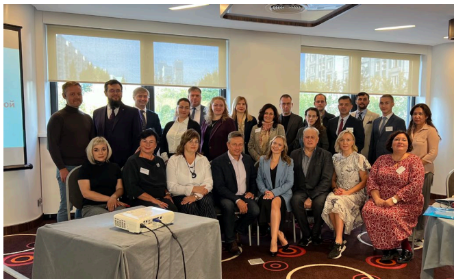
Участники семинара для адвокатов в Москве