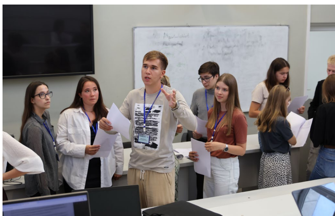
Участники XIII Международной летней школы профессиональных навыков юриста в Калининграде