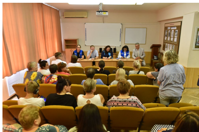
Встреча по оценке потребностей с беженцами из Украины в Воронежской области