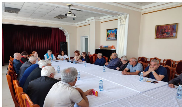
Встреча по оценке потребностей с вынужденно перемещенными лицами из Карабаха, проведенная УВКБ ООН и НКО-партнером в Пятигорске, Ставропольский край