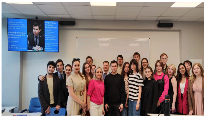
Церемония награждения победителей Конкурса студенческих аналитических работ по праву беженцев в РУДН