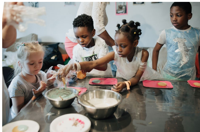
Мастер-класс по изготовлению десертов для детей-беженцев в Музее Москвы по случаю Всемирного дня беженцев