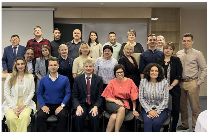
Семинар для адвокатов в Красноярске