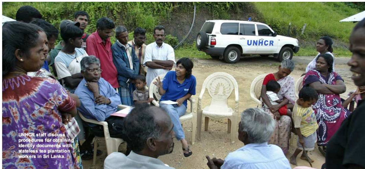
Сотрудники УВКБ ООН обсуждают процедуру получения удостоверений личности с лицами без гражданства, работающими на чайной плантации в Шри-Ланке.

14. Определенные нормы по правам человека составляют часть международного обычного права и по этой причине они применимы в отношении всех государств, независимо от обязательств того или иного государства согласно конкретным соглашениям. В частности, запрет на расовую дискриминацию является ключевой обычной нормой, применимой как по отношению к приобретению и (или) утрате гражданства, так и к обращению с лицами без гражданства.