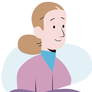
فەرمانبەرى ئۆينەرى IPO

فەرمانبەرىكى IPOش لە دانىشتنەكەدا دەبىت. لە دانىشتنى IPATدا، ئەندامەكەى داداگا دەتوانىت لەسەر برىارى IPO پرسیار لەم فەرمانبەرە بکات.