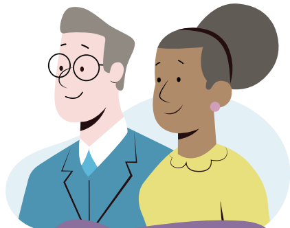
پارمەتیدەرى كۆمەلایەتەى و پارىزەر

ھەندىك جار لەوانەھە شایەتەكان لە دانىشتنەكەى IPAT دا بەشدار بن. شایەتیک زانیارى پەيوەست بە داواكارى پەناپەرىت بە ئەندامەكەى داداگا رادەگەیینىت، بۆ نمونە گەر بزانیت لە رابردودا پرووداوتیک بۆ تۆ و/یان بۆ خیزانەكەت پرووى داو. گەر ئەم بابەتە پەيوەست بىت بە داواكارى پەناپەرىتەكەت، پارىزەرەكەت لەمبارمۆه گەتتوگۆت لەگەل دەكات.