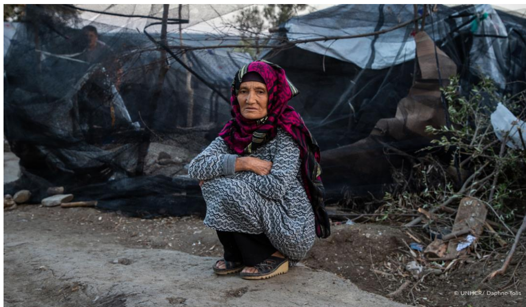
Μια ηλικιωμένη γυναίκα μπροστά στα αυτοσχέδια καταλύματα στο Κ.Υ.Τ. της Μόριας στη Λέσβο, όπου οι αιτούντες άσυλο πασχίζουν να ανταπεξέλθουν στον υπερπληθυσμό, τις κακές συνθήκες διαβίωσης και την περιορισμένη πρόσβαση σε βασικές υπηρεσίες, όπως η ιατρική περίθαλψη.

Θεσσαλονίκη, Λέσβο, Αττική, Χίο, Σάμο, Κω, Έβρο, Ιωάννινα, Λέρο και Ρόδο