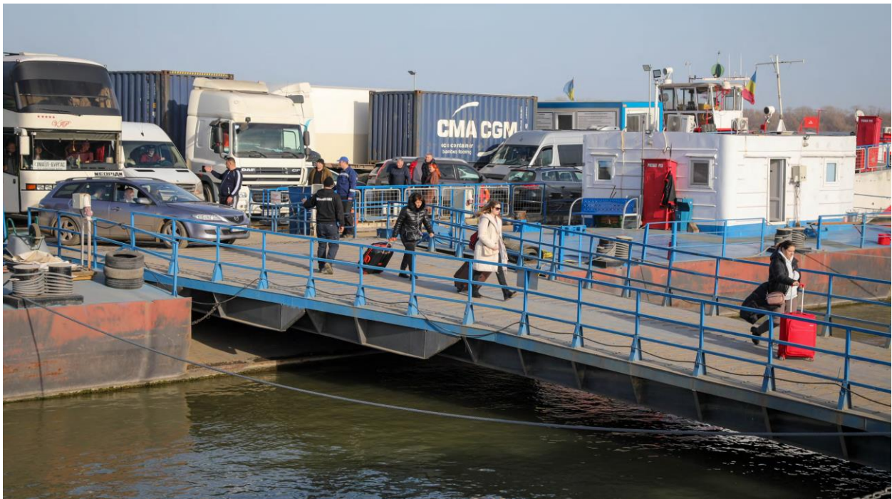
Хора, които слизат от ферибот на КПП Исакчеа Румъния