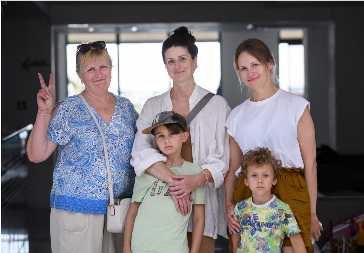
Бежанци от Украйна в процес на преместване от хотели в държавни бази