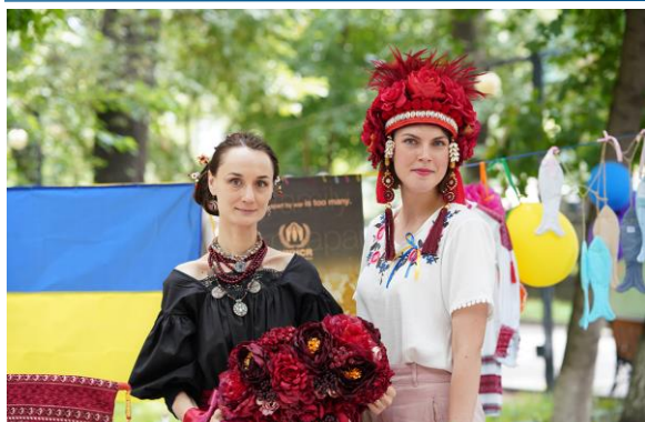
#Փախստականների համաշխարհային օրվա տոնակատարությունը՝ միջմշակութային միջոցառումներով եւ երեխաների ձեռքի աշխատանքներով

մասնակցել է ՄԱԿ ՓԳՅ գործընկեր Հայկական Կարմիր խաչի ընկերության կողմից կազմակերպված ընդհանուր բնույթի տեղեկատվական եւ տնտեսական ինտեգրման հավաքների: