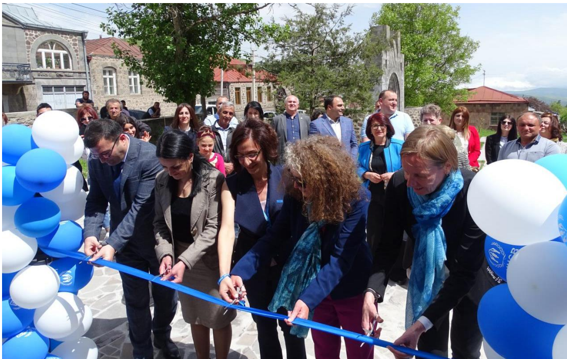
ՄԱԿ ՓԳՅ Գորիսի գրասենյակի բացման պաշտոնական արարողությունը 2022 թ. մայիսի 24-ին, Վերիշեն գյուղ, Սյունիքի մարզ:

Տեղահանված անձանց բարեկեցության եւ հիմնական կարիքների բավարարման նպատակով ՄԱԿ ՓԳՅ-ն շարունակում է տրամադրել դեպքերի կառավարման եւ մասնագիտացված ծառայություններ՝ հիմնված իրավական պաշտպանության մշտադիտարկման եւ օգնության թեժ գծի գործարկման արդյունքների վրա: Կենսապահովման ծրագրերի, ինչպես նաեւ մասնագիտական դասընթացների եւ հայոց լեզվի դասընթացների հասանելիության ապահովման հետ մեկտեղ՝ ՄԱԿ ՓԳՅ-ն շարունակում է դրամական աջակցություն ցուցաբերել խոցելի տեղահանված անձանց: Կարեւոր գործողություն է լինելու նաեւ երեխաների պաշտպանության կարիքների վերհանման եւ գենդերահեն բռնության զոհերի վաղ հայտնաբերման ու արձագանքման համապատասխան գործողությունների կազմակերպման թեմաներով գործընկեր կազմակերպությունների կարողությունների զարգացումը: