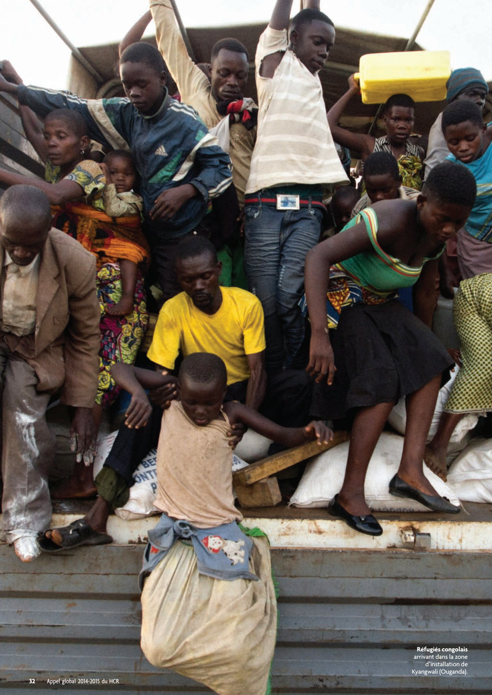
Réfugiés congolais arrivant dans la zone d'installation de Kyangwali (Ouganda).