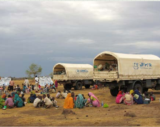
À Tissi, des réfugiés attendent de monter à bord des camions qui les conduiront au camp d'Ab Gadam.

Cet article est une version adaptée d'une chronique d'actualité du HCR